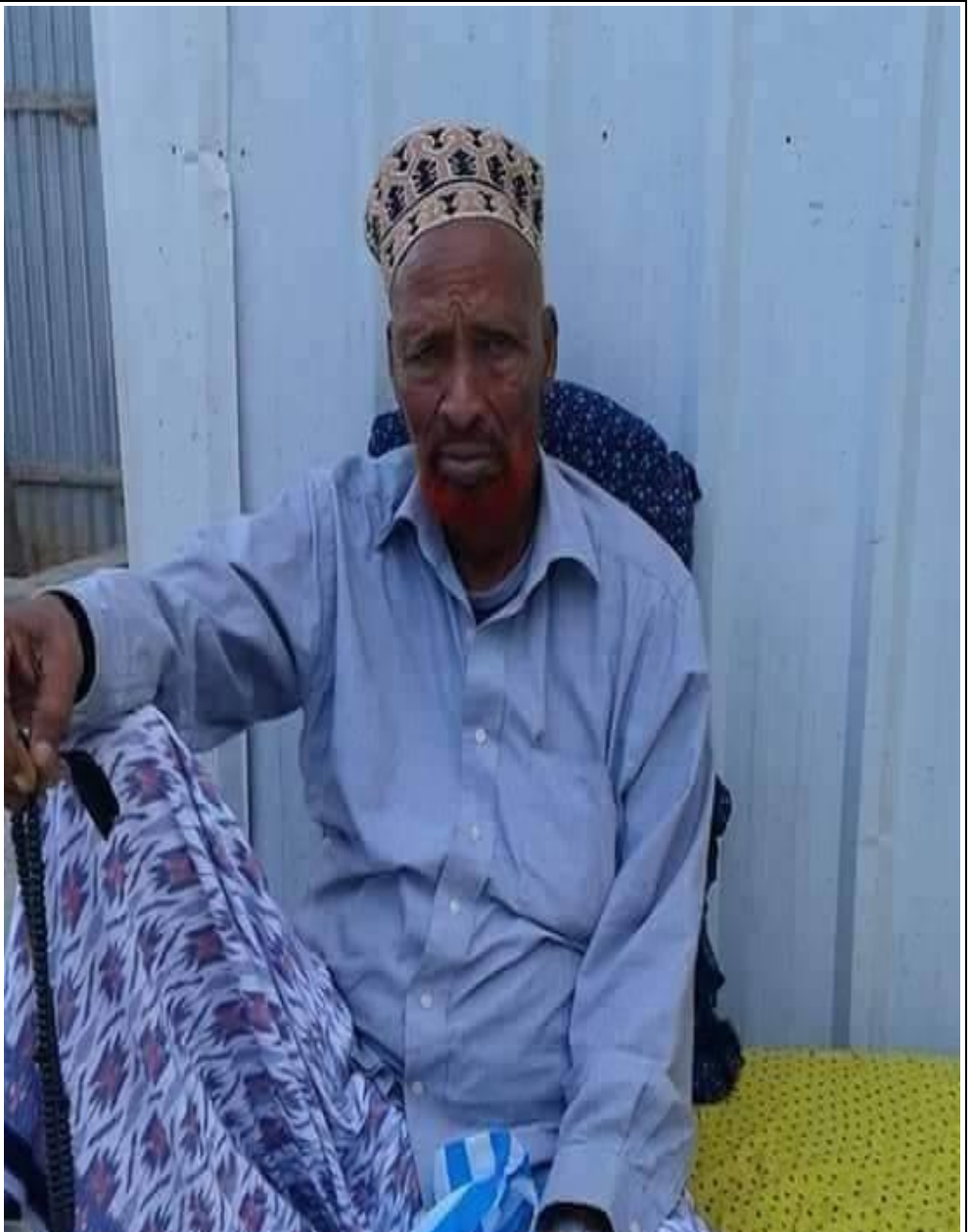
Abbahay Maxamed Diini Samatar (1939?-2018)